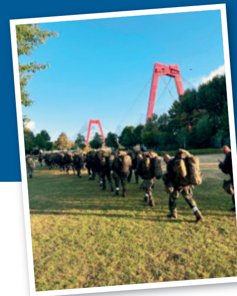
Eindmars met op de achtergrond de Willemsbrug (R'dam). Mijn bekpakking bestond uit een tas vol stroopwafels en pepermunt.

S inds augustus 2024 ben ik dominee bij Defensie. Met welke motivatie ben ik begonnen? En zijn mijn verwachtingen werkelijkheid geworden? Of is het werken bij Defensie toch heel anders dan gedacht? Met andere woorden: past het nieuwe jasje of toch niet?