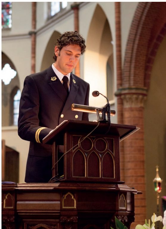
Professionele standaard voor geestelijk verzorgers in de krijgsmacht